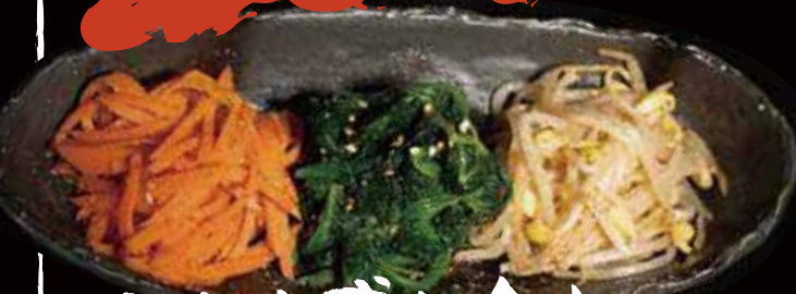
ナムル盛り合わせ