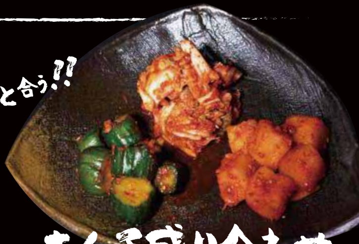
キムチ盛り合わせ